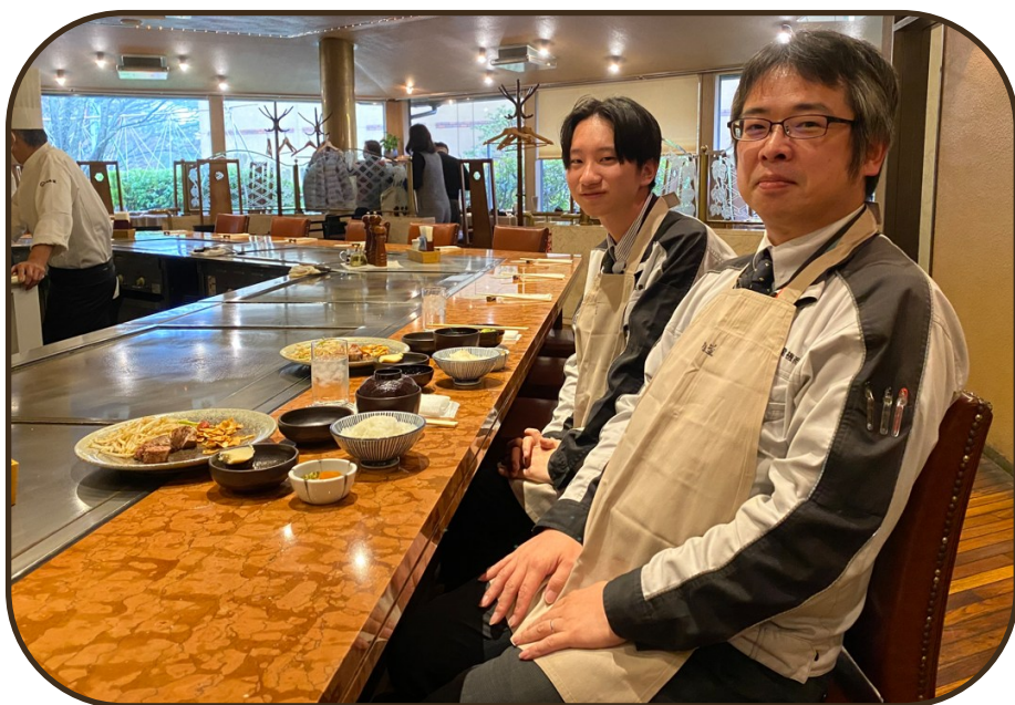
樹林厨房 金沢 六角堂 〒920-0838 石川県金沢市観音町3-4-42 営業時間11:00～15:00 17:00～22:00