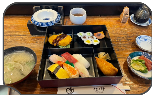
日替わり弁当(にぎり)