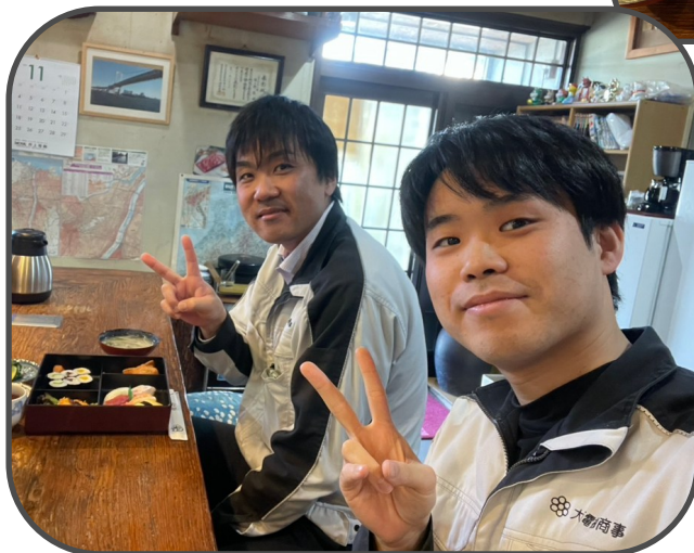
御食事処 佐々野 富山県高岡市井口本江241-8

今回頂いたのは日替わり弁当で、曜日によってメニューが変わるので毎日通っても飽きないお店です。今回行った金曜日は必ず「にぎり」のメニューとなっています。カウンターに座ると、大将が目の前で握ってくれ