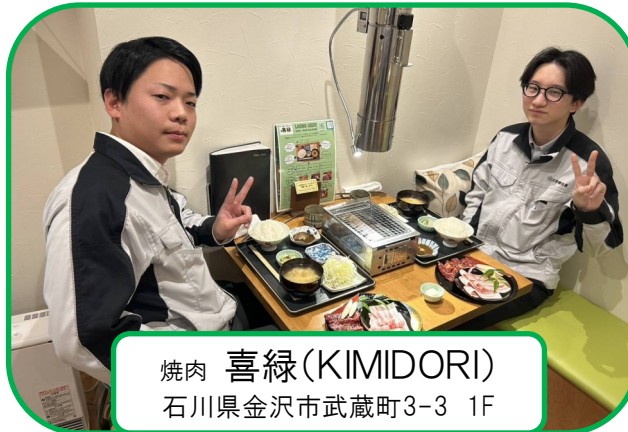
焼肉 喜緑(KIMIDORI) 石川県金沢市武蔵町3-3 1F

ん・千切りキャベツ・水キムチ・お味噌汁・豚バラとハラミの相盛肉が付いた盛りだくさんの定食です！ お肉がおいしいのはもちろんですが、さっぱりつけ汁まで