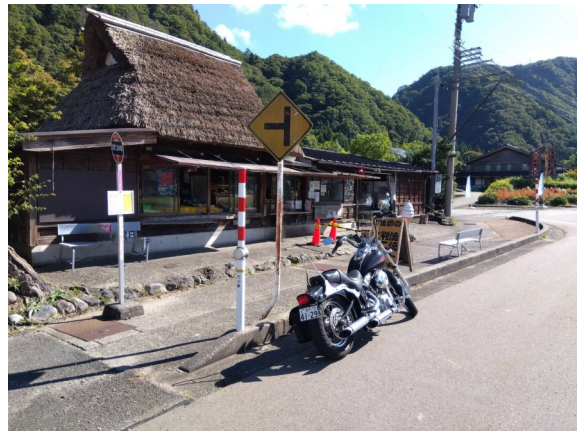
大判焼が人気な【山法師】さん 石川県白山市吉野春25