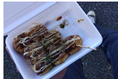
大判焼が人気なのですが、今回はあえてのたこ焼きをチョイス。