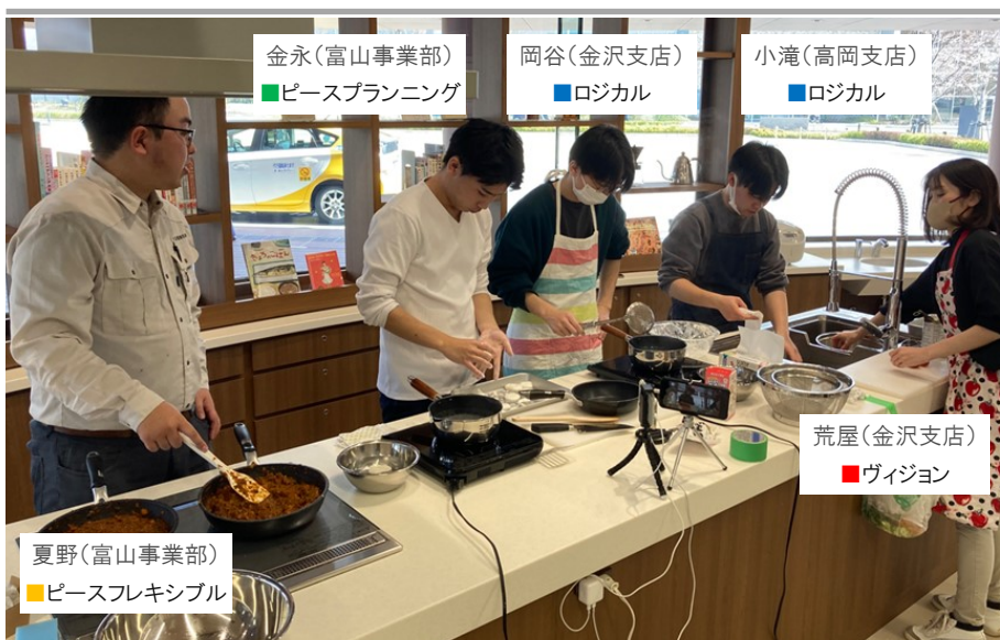
上野主催の性格統計学ワークショップの様子 日時：4月5日（金）10:00～15:30 会場：石川県立図書館／食文化体験センターにて

このようにコミュニケーションギャップが引き起こすモヤモヤを解消するには、自分がどのような価値観を持ち、どのように物事を進めるタイプなのかという意味で自分を知る、同様に相手を知る、そして両者の違いを知るというステップが必要です。