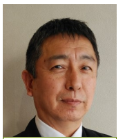
ピースプランニング

さて私事です。早いものでこの四月、弊社にお世話になって43年目を迎えました。この間の技術の進歩には目を見張るものがあります。昔の固定電話に手書き伝票、エアコンなしのトラックでの配達。など今の新入社員には理解できないかもしれません。(携帯、パソコン、メール。鉄管からPF管)しかし商売の本質は42年前と何ら変わっていないと思います。初心を忘れず、まだまだ頑張りますので宜しくお願いいたします。