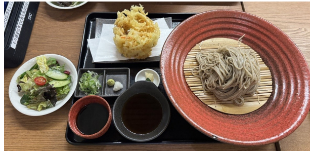
かき揚げ天盛りそば(並盛) ¥990

場所は富山市二口町にある『そばでおもてなし OLMBA』。今回はかき揚げ天盛りそばを頂きました。一番にそばの器が大きくて驚かされました。これだけ