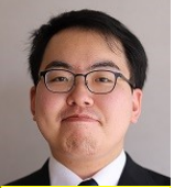
ピースフレキシブル

友人と飲みに行ったパーツと使ったような気がします。学生の時とは違いそこそこ高価な場所に行ったはず。今思えば勿体なかったように思います。