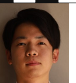
ピースフレキシブル

高校時代、新聞配達で初めて給料で母親にケーキを買いました。母親が涙を流して喜んでいたので今でも覚えています。