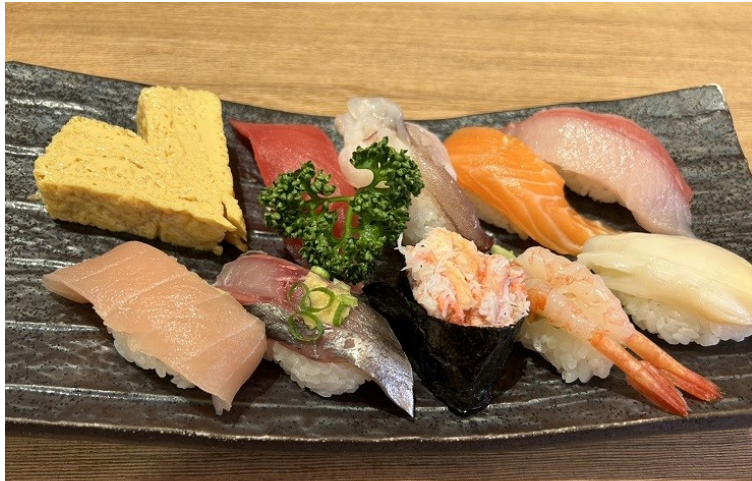
もりもり寿司 藤江店 (石川県金沢市藤江南3-10) おまかせにぎり(B)うどん付き ¥1580

今月のおさめしは先日、金沢支店の福井課長に連れて行って頂いたお寿司ランチを紹介致します。