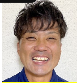
ピースフレキシブル