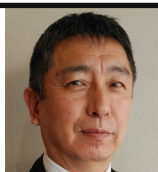
ピースプランニング