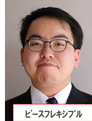
ピースフレキシブル

重度の花粉症ですが、花見をしたいです。わいわい、がやがやもいになって思っています。長らくイベント事に参加していないので、少し恋しいです。