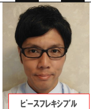
ピースフレキシブル

旅行！TDLには1年目、10.15.20.25.30年目に訪れています。今年40周年、TVでもバンバン流っていて体がうずうずしてきます。