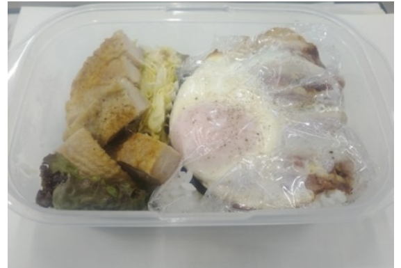
本日の献立 海苔ご飯、ベーコンエッグ、鶏モモ肉の照り焼き 省略コールスローとレタスサラダ

しかし、コンビニに寄らず帰宅することを心掛けると目に見えて財政状態が改善され始めていたのでカードの履歴を確認してみると先月だけで支払い金額が〇万円となっております。かなり血の気が引く額だったので皆様も月の終わりにカードの使用金額と支払先の確認すると節制+ダイエット