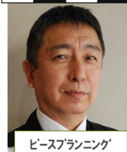
ピースプランニング