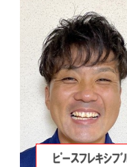
ピースフレキシブル

春にはもう制限が緩和されるので少し遠い所へ旅行に行きたいです。(北海道や沖縄に行ってみたいのですが...)