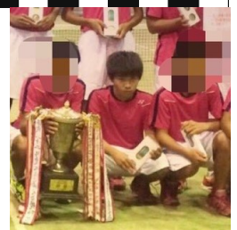
高校2年生の時に、全国選抜県予選団体戦で優勝したときの写真です。