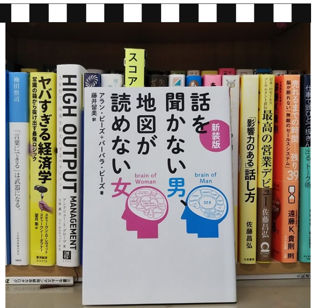
アラン・ピーズ + バーバラ・ピーズ著