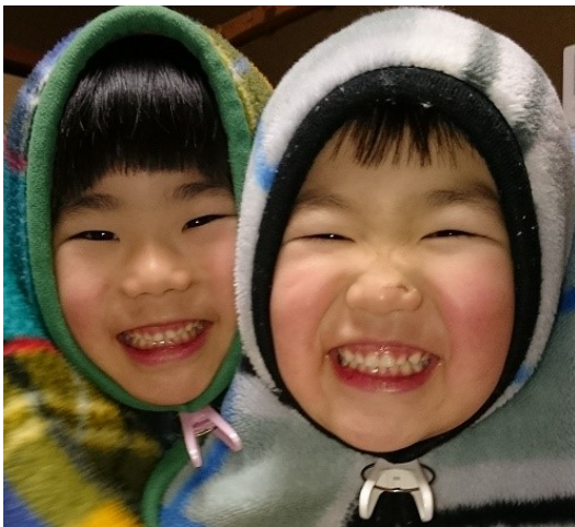
次女と三女の顔なしの真似

450回と15回。これ何の回数か知ってますか？ 子供が一日に笑う回数と大人が一日に笑う回数の平均だそうです。ちょっとびっくりしませんか？ 私たちはいつから435回も笑わなくなったんでしょうか…。