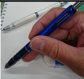
ゼブラのデルガード

0.5mmごときのシャープペンの芯では一文字書くごとに芯を折ってしまう筆圧してます。どうも、原です。そんなわけで普段は2.0mmの芯使ってます。大工さんとかが使うやつです。しかし、そんな筆圧自慢のあなた(私)の強い味方を発見しました!。使ってる人からすれば「今更?」なんでしょか…(笑)。しかし、すごいですよ。折れないんですよ!折ろうとしても折れないんですよ(驚)「いや〜、学生のころに出会いたかったですね」