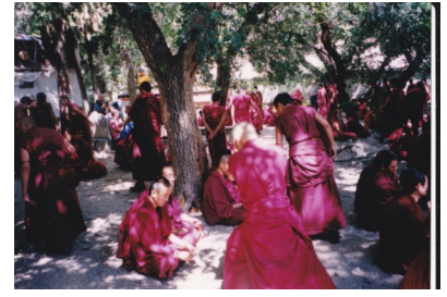
ある寺院にて。修行中の僧侶。