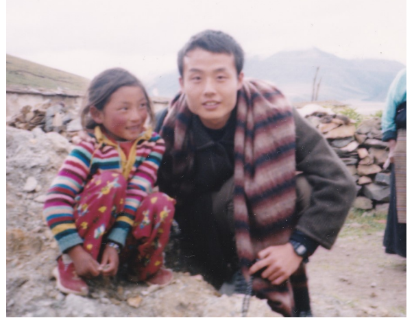
ドライバーの家族と共に。20年前の「私」