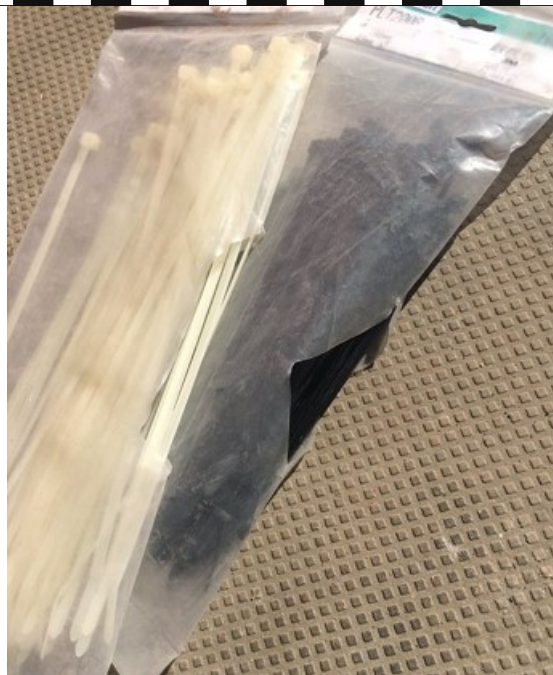
袋の横側からインシュロックを取り出せるように切り込みを入れる