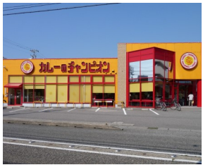
カレーのチャンピオン