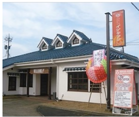
インディアンカレー