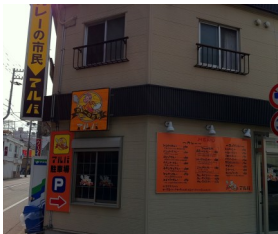
カレー市民アルバ